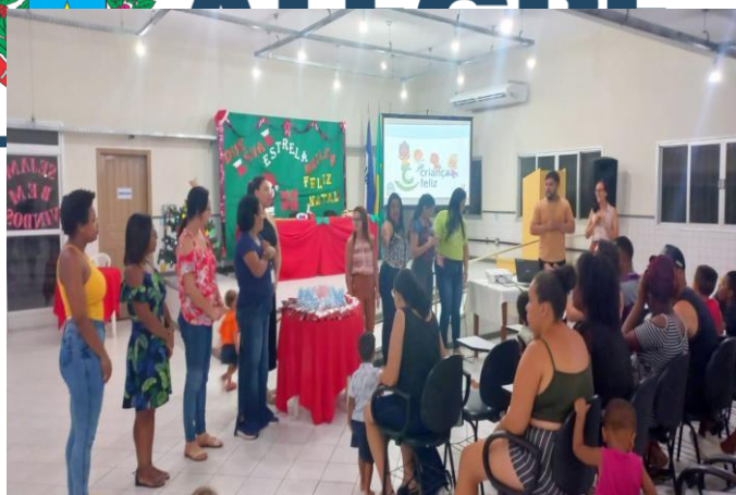
PROGRAMA ACESSUAS TRABALHO